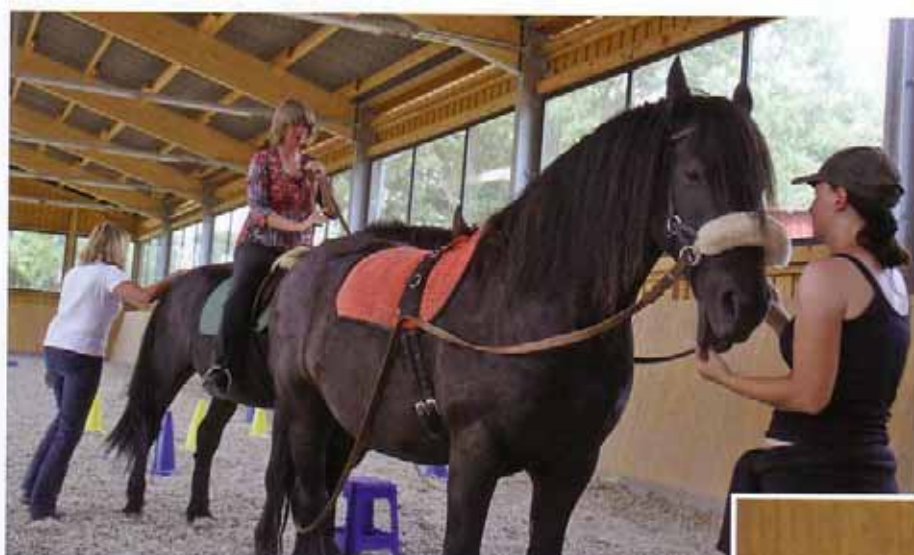
Zielorientierung, Mut und Selbstsicherheit erfordert die Übung „Chaos Management“. Es geht mit zwei Pferden durch Hindernisse zum Ziel.