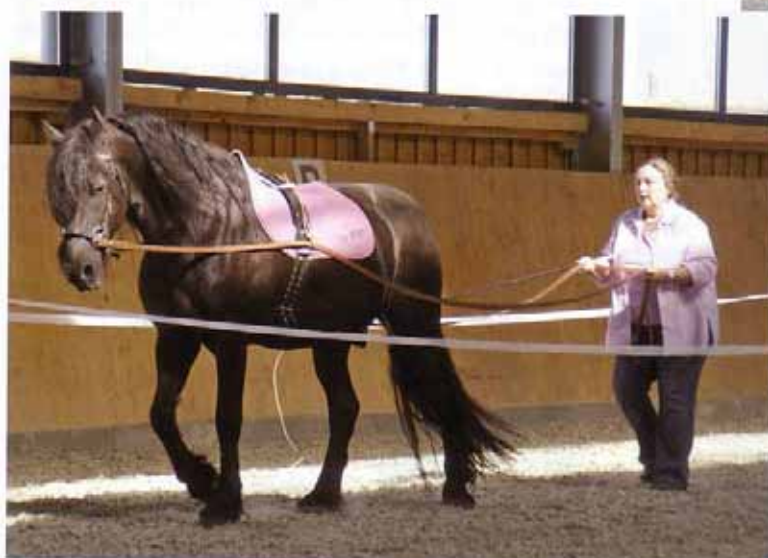
Führen aus dem Hintergrund. Bildhaft speichern die Seminarteilnehmer das Erleben der drei grundlegenden Führungspositionen im Management.