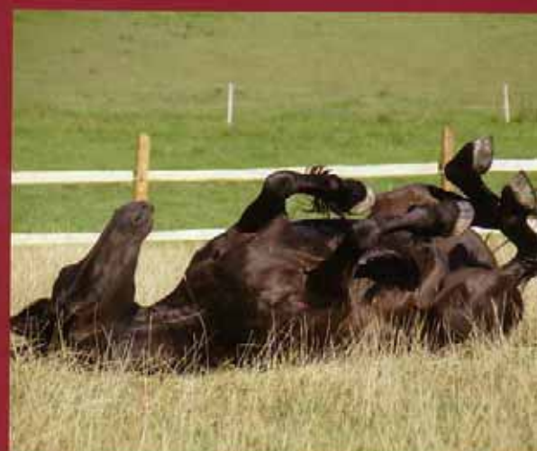
Auf der Koppel sind die Seminarpferde wieder ganz normale Pferde.