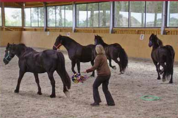
Face to Face with Horses: Ich bin der Boss, die Pferde sind mein Team. Gut, sich an der Fahne, dem Führungs- oder Machtinstrument, festhalten zu können.