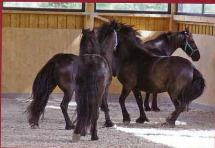
Beobachten und beurteilen: Vier Pferde toben in der Halle, noch kann sich kein Teilnehmer vorstellen, mit diesen wilden Riesen eine Führung zu absolvieren.