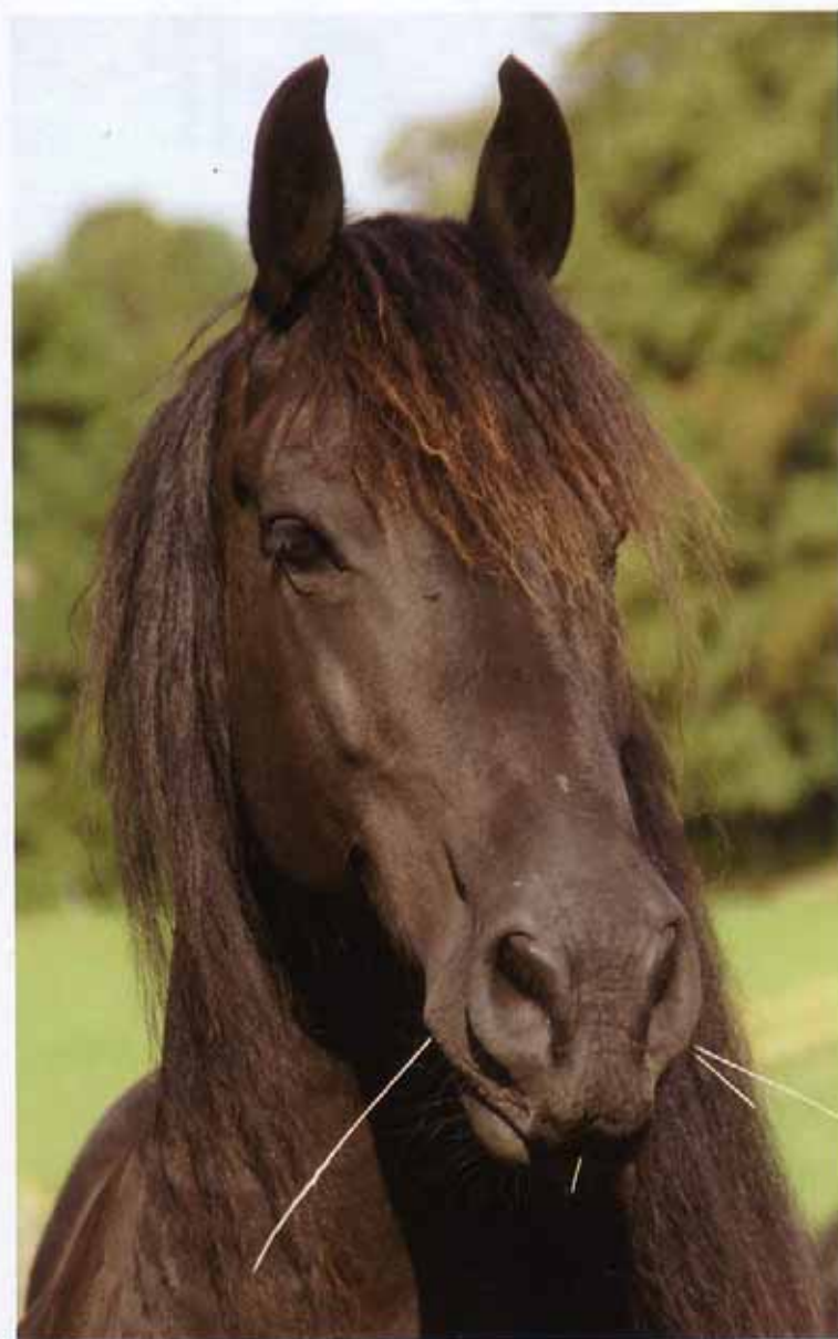
Die Seminarpferde nehmen den Menschen die Angst vor dem großen Unbekannten.