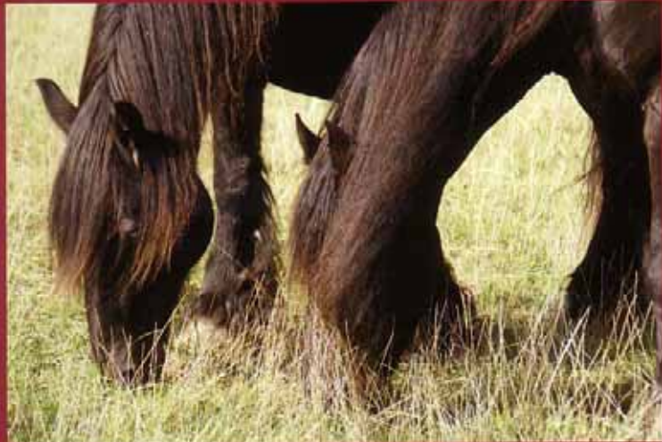
Distanz und Nähe: Die Pferde geben dem Menschen die Möglichkeit, Nähe neu zu erleben.