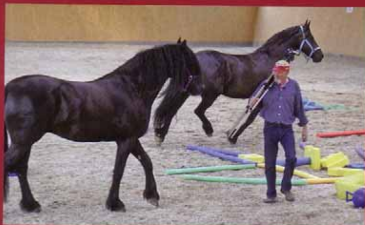
Beobachten und beurteilen: Die Kamera hat alles festgehalten. Nun geht es in die Feedbackrunde.