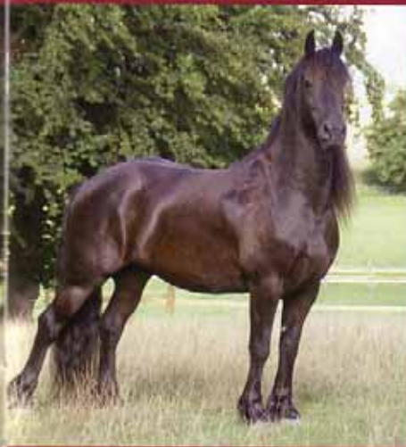
Gueet, genannt Goody, zu seinen Vorfahren gehört Haerke 254