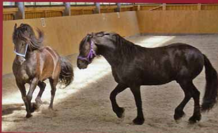
Beobachten und beurteilen: Körpersprache und Mimik sind sichtbare Mittel der Kommunikation.