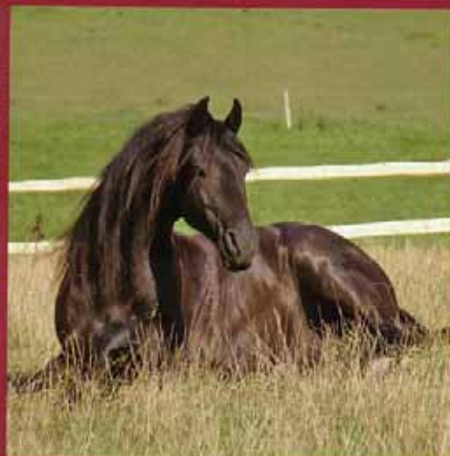
Intelligenz, Kraft, Schönheit und Freiheit. Das sind Attribute, die Menschen dem Pferd zuordnen.