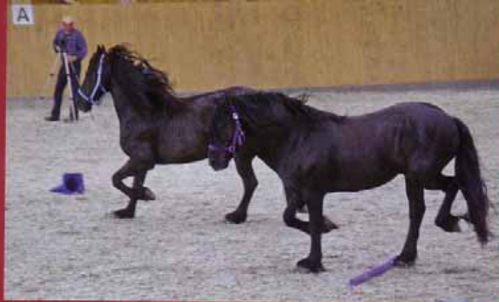
Beobachten und beurteilen: Wer andere bewegt, der führt.

Aber es durchdringt auch die innere Schale, weil Furcht zu seinen Instinkten als Fluchttier gehört. In der Vertrauensfindung kommuniziert das Pferd direkt mit dem „Ich“. So bricht es Öffnungen in die äußeren Schalen der Persönlichkeit des Menschen, die so eine Kommunikation „ohne Maske“ erleben. Nacheinander werden manchmal alle Schichten des Persönlichkeitsmodells sichtbar, wo am Ende ein tiefes Empfinden von Gemeinsamkeit steht. Das Pferd folgt dem Menschen ohne jedes Hilfsmittel wie Halfter oder Strick. Das heißt Führung erleben.